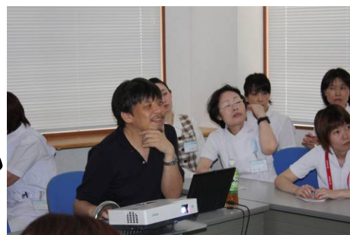
ゆうえん医院結縁医師によるめまいについての勉強会